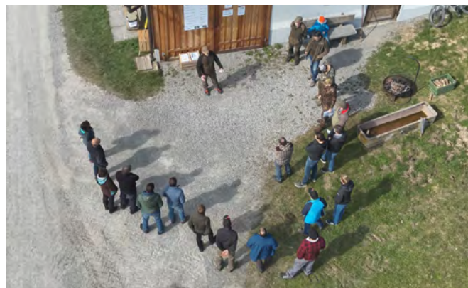
Landwirte bei der Jagdgesellschaft Andwil

das Leben und Verhalten der Rehe, über die herkömmliche Verblendmethode und konnte die Suchflüge der Drohne über die Wiese zu Demonstrationszwecken direkt mitverfolgen. Damit die Rehkitzrettung auch in der Praxis funktionieren kann, ist eine enge Zusammenarbeit zwischen der Landwirtschaft und Jägerschaft zwingend. Die Jagdgesellschaft Andwil zeigte auf, welche Rahmenbedingungen erfüllt sein müssen. Das grosse Interesse der Landwirte zeigt, dass die Voraussetzungen dazu in Andwil ideal sind. Der gelungene Anlass wurde durch einen Imbiss, spendiert durch die Jagdgesellschaft Andwil, abgeschlossen.