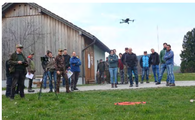
Drohnen mit Wärmebildkameras

In der Vergangenheit war die Verhinderung von Kitzvermähungen sehr zeitaufwändig und mässig erfolgreich. Seit einigen Jahren werden Drohnen mit Wärmebildkameras eingesetzt, um die Felder vor der Mahd abzusuchen. Diese Methode führt zu sehr positiven Resultaten. Der Jagdgesellschaft Andwil ist es ein grosses Anliegen, die Landwirte bei der Rehkitzrettung zu unterstützen. Deshalb sollen die Rehkitze auch dieses Frühjahr mit einer Drohne, die mit einer integrierten Wärmebildkamera ausgestattet ist, am frühen Morgen vor der Mahd gesucht und dann aus der Wiese gerettet werden. Ein Andwiler Unternehmer hat letztes Jahr der Jagdgesellschaft in grosszügiger Weise eine Drohne finanziert, welche auf einem hohen technischen Stand ist. Damit kann die Unterstützung der Landwirte noch effizienter und erfolgreicher umgesetzt werden.