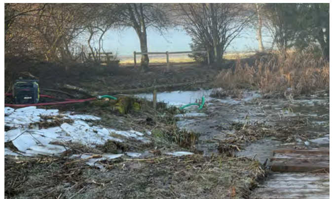
Rückblick Dezember 2025