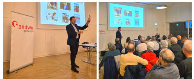
Eindrücke vom Anlass im Otmarzentrum

Über die zukünftige Entschädigung für dieses politische Amt entscheidet der Gemeinderat im Rahmen der geltenden Reglemente und basierend auf der Vorbildung und Erfahrung des Kandidaten.