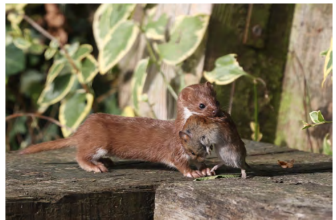
Wiesel ernähren sich von Mäusen und sind wertvolle Mitarbeiter in der Landwirtschaft.